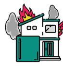
火災、落雷、 破裂・爆発