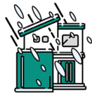
ひょう 風災、雹災、雪災